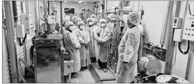
진안군 농업기술센터는 지난 22일 진안군농산물종합가공센터에서 '2026년 농식품 가공창업 아카데미' 교육생들을 대상으로 식품가공실습을 진행했다.

이날 교육생들은 농산물종합가공센터 가공실에서 직접 식품 가공 과정을 경험하며 현장 감각을 익혔다