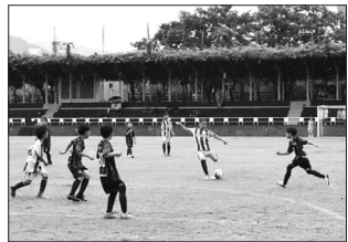
찾아 열띤 경쟁을 펼쳤다. 참가 선수들은 학년별 조별 예선을

대회에는 전국 48개 유소년 축구팀이 참가했으며 초등학교 2학년부부터 6학년까지 선수 650명을 비롯해 지도자와 학부모 등 총 1,900여 명이 무주를