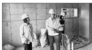
건을 확보할 계획이다.

특히 현재 공사는 올해 7월 준공을 목표로 차질없이 진행되고 있으며 군은 진입도로 확장과 회전교차로 설치, 보행 안전시설 강화 등을 설계에 반영해 주민들의 안전하고 원활한 통행 여