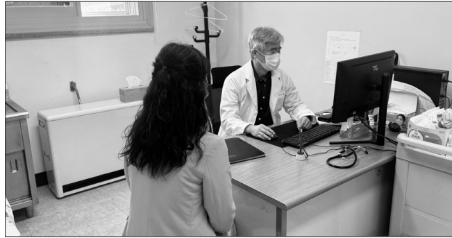
진안군은 임상경험이 풍부한 전문 관리의사를 선제적으로 확보·배치하며 안정적인 공공의료체계 유지에 힘쓰고 있다.

먼저 지난 4월 20일, 풍부한 임상경험을 갖춘 기간제 관리의사를 채용해 백운보건지소에 배치했다. 해당 의료진은 현재 만성질환 관리와 건강 상담 등 지역 주민 건강관리의 핵심 역할을 수행하고 있다. 이어 5월 11일에는 부귀보건지소에 시니어 의사를 추가 배치했으며, 오는 15일부터는 전북특별자치도의 '지역보건기관 필수의료인력 지원사업'과 연