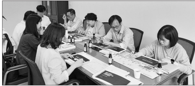
무주군이 2027년 지방소멸대응기금 확보를 위해 전문가 컨설팅과 주민 의견 수렴, 부서 간 협업을 기반으로 한 투자계획 수립에 총력을 기울이고 있다.

앞서 지난달 27일 열린 전략회의에서는 정부의 지방소멸 대응 정책 기조와 평가 기준을 분석·공유하고, 이에 부합하는 차별화된 사업 전략 마련 방안을 논의했다.