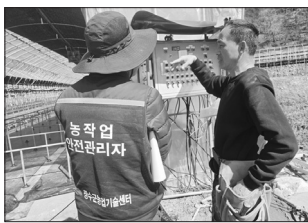
한편 군은 농작업 중 빈번하게 발생하는 근골격계 질환과 농기계 사고, 넘어짐 사고 등을 예방하기 위해 작업 자세 개선과 안전장비 활용 교육도 병행할 예정이다. /장수=고관호 기자

또한 단순 점검에 그치지 않고 농가별 특성과 작업 여건을 반영한 맞춤형 솔루션을 제공한다.