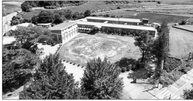
진안군은 인구감소 대응과 작은 학교 살리기를 위한 주거 기반 마련에 본격 나섰다. 사진은 오천초등학교 전경.

이 사업은 한국토지주택공사(LH)와 협력해 추진하는 공공임대주택 공급 사업으로, 민간사업자가 주택을 신축하면 LH가 이를 매입해 임대주택으로 공급하는 방식으로 진행된다. 공급 규모는 총 30호로 △귀농·귀촌 20세대 △농촌유학 가족 10세대를 대상으로