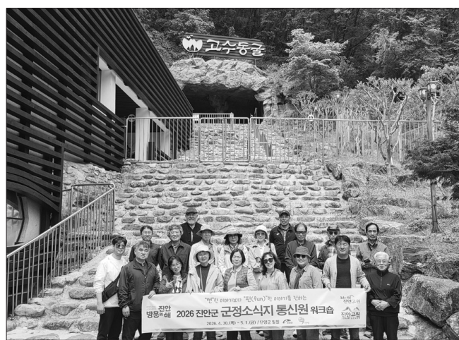
진안군 군정소식지 '호남의 지붕 진안고원' 통신문 20여 명이 지난 4월 30일부터 5월 1일까지 1박 2일간 충북 단양군 일원에서 역량강화 워크숍을 진행했다.