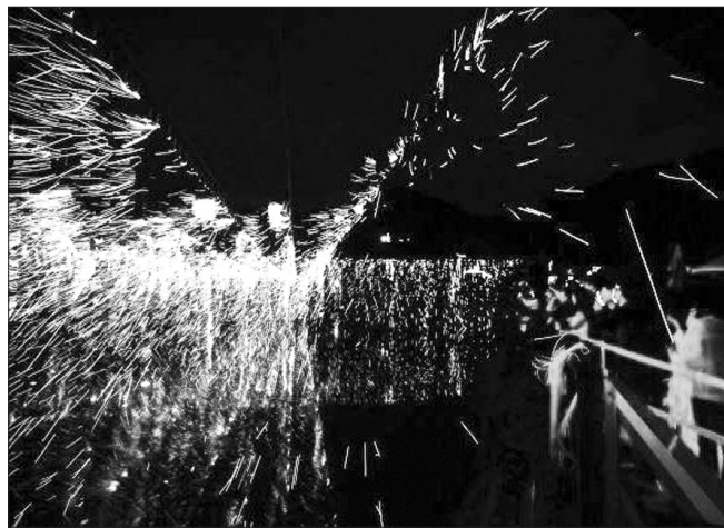
전북특별자치도 무형유산으로 지정된 무주 안성면 두문마을 낙화놀이가 올해부터 사전 예약제와 유료로 전환해 운영된다.

또한 불꽃이 바람결에 흩날리는 모습이 마치 꽃이 떨어지는 것과 같다고 해서 '낙화(落花)놀이'로도 불리며, '낙화봉'이 타오를 때 서서히 피는 불꽃과 숲이 타들어 가며 내는 소리, 그