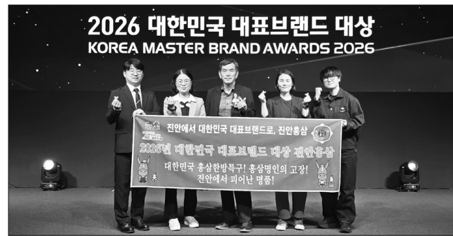
진안군 홍삼제품 공동브랜드 ‘진안홍삼’이 ‘2026년 대한민국 대표브랜드 대상’ 인삼제품 공동브랜드 부문에서 선정됐다.

진안군 홍삼제품 공동브랜드 ‘진안홍삼’이 2026년 대한민국 대표브랜드 대상 ‘인삼제품 공동브랜드 부문’에서 선정됐다. ‘대한민국 대표브랜드 대상’은 동아닷컴, 한경닷컴, MBC가 공동 주최하고 대한민국 대표브랜드 대상 선정위원회와 피플인사이트가 주관하는 국내 최고 권위의 브랜드 시상식으로, 매년 소비자 설문조사를 통해 부문별 최고의 브랜드를 선정한다. 이번 평가는 2026년 1월 30일부터 2월 12일까지 전국 소비자를 대상으로 온라인 설문조사를 통해 진행됐으며, 최초 상기도(TOM), 보조 인지도, 브랜드 차별화, 신뢰도, 리더십, 품질, 충성도 등 7개 항목에 대한 종합 평가로 이루어졌다. ‘진안홍삼’은 인삼제품 공동브랜드