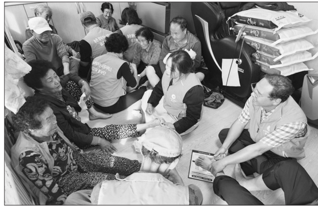
무주군이 농촌 고령화와 인구 감소에 대응하기 위한 찾아가는 사회서비스를 본격 운영한다.