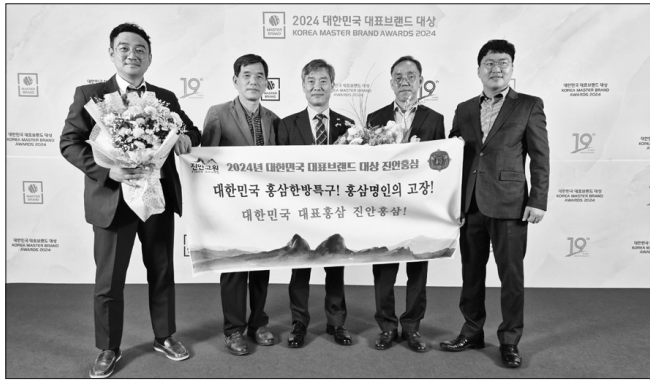
진안군 홍삼제품 공동브랜드인 '진안홍삼'이 대한민국 대표브랜드 선정위원회 주관으로 17일 신라호텔에서 개최된 2024년 대한민국 대표브랜드 시상식에서 인삼제품 공동브랜드 부문 대상을 수상했다.

체력증강, 노화억제, 항암작용, 항당뇨, 간 기능 증진, 증금속 해독 등의