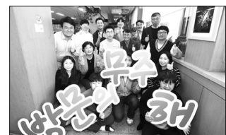
이는 공직 내부에서부터 친절과 존중, 배려 분위기를 정착시켜 업무 만족도와 성과를 높이고 대민만족도를 향상시킨다는 취지가 담겨 있어 눈길을 끌고 있다. /무주=전문선 기자

또 매월 1일을 '원 데이(one day)-원 팀(one team)'의 날로 정해 개인과 조직의 업무능률을 높이는 등 군정 경쟁력 향상에 주력할 방침이다.