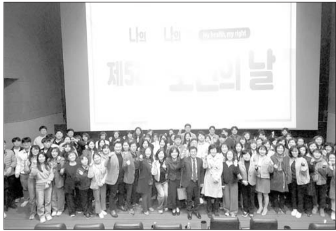
정읍시보건소는 지난 3일 정읍 CGV 제2관에서 '나의 건강 나의 권리(my health, my right)'라는 슬로건으로 제52회 보건의 날 기념식을 가졌다.