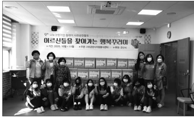
(사)군산시자원봉사센터는 최근 금강노인복지관(관장 박희수)과 군산노인종합복지관(관장 박민권)을 이용하는 어르신 200명에게 행복꾸러미를 전달했다.