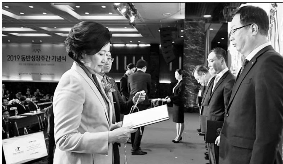
지난 6일 진행된 2019 동반성장주간 정부포상 시상식에서 aT 기호선 기획조정실장(사진 오른쪽)이 박영선 중소벤처기업부 장관으로부터 국무총리 표창을 수여받고 있다.

자세한 사항은 이스타항공 홈페이지(www.istarjet.com)와 모바일에서 확인 가능하다. /김윤상 기자