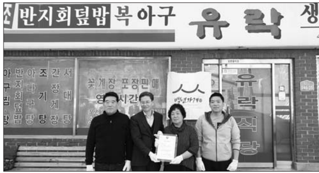
전북지방중소벤처기업청은 지난 8일 군산 유락식당에서 백년가게 현판식을 열었다고 밝혔다.

이번 백년가게로 선정된 '유락식당'은 1981년부터 38년간 군산에서 밴댕이로 만든 '반지회', '반지회덮밥'과 '꽃게장'으로 지역 미식가들에게 유명하며, '착한가게'와 '군산맛