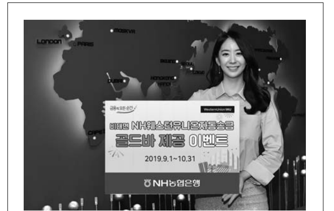
NH농협은행이 '비대면 NH웨스턴유니온자동송금' 이벤트를 진행한다.

를 조사한 결과 95점의 높은 만족도를 보였으며, 2기 과정은 1기 운영결과를 바탕으로 더욱 내실있는 교육운영을 위해 수업일수를 확대하고 교육환경도 개선했다. 2기 교육과정은 10월 8일부터 8주간(주2회) 진행되며, 풍선아트는 매주 월·화, 이미용은 목·금요일에 진행된다. 수업에 필요한 교구와 수강료 등은 전액 무료로 제공된다. 참여를 원하는 LH임대주택 입주민은 9.24일 오전 10시부터 9월 28일 오후 5시까지 LH전북본부 8층 경영혁신부에 방문하여 신청하며, 선착순으로 모집한다. 자세한 문의사항은 230-6124, 6125로 문의하면 된다. /김윤상 기자