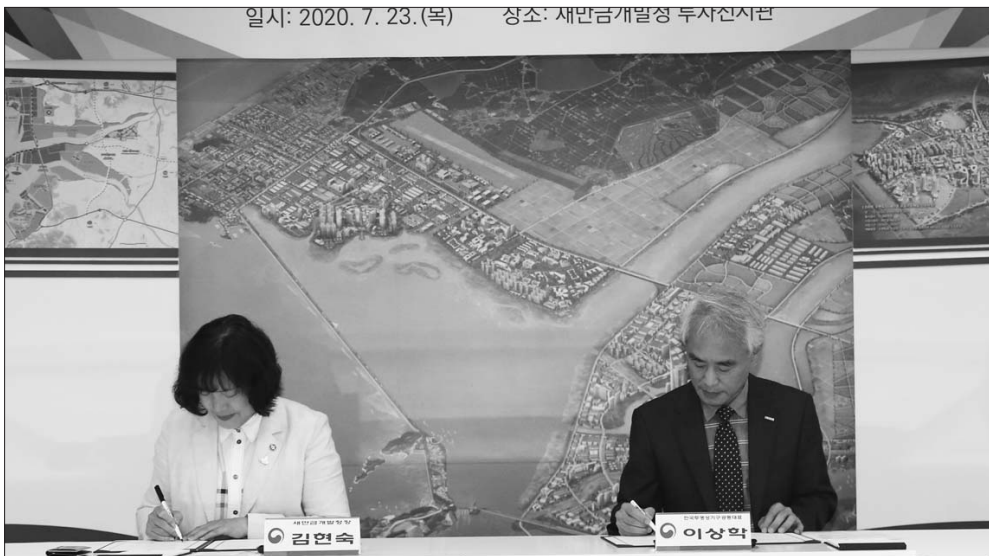
일시: 2020. 7. 23.(목) 장소: 새만금개발청 투자전시관 새만금개발청은 23일 서울 새만금투자전시관에서 국제투명성기구 한국본부인 한국투명성기구와 반부패 및 청렴도 제고를 위한 업무협약을 체결했다.