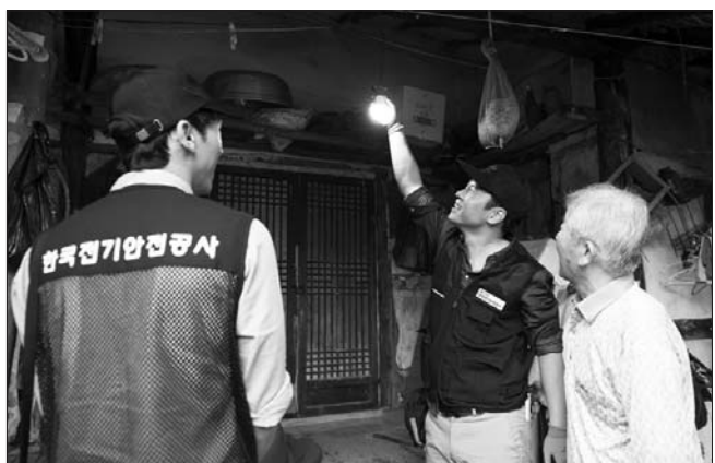
한국전기안전공사가 제공하는 국가유공자 노후·불량 전기설비 개선 서비스.

라미) 등 총 8분야 17종목에서 열린다. 각 분야별로 전문심사위원의 평가를 거쳐 농식품부장관상(1점), 서울특별시장상(4점), 농촌진흥청장상(4점), 국립농업과학원장상(10점) 등 총 49점을 시상할 예정이다. 이번 행사 관람 신청은 26일까지 애완곤충경진대회 누리집(www.대한민국애완곤충경진대회.com)에서 할 수 있으며, 사전등록자만 입장할 수 있다. 관람객은 코로나19 확산 방지를 위해 사전등록 후 발급받은 QR코드가 있어야 입장이 가능하다. 관람은 하루 3회로 나뉘며 동시 관람객이 500명 이하가 되도록 조절된다. 사전등록을 하지 못했거나 코로나19로 행사장 방문이 어려운 시민을 위해 곤충 전시물과 현장 모습을 볼 수 있는 동영상은 온라인에 공개하는 비대면 행사도 운영할 예정이다. 농촌진흥청 곤충산업과 남성희 과장은 "최근 관심이 높아지고 있는 애완곤충을 누구나 쉽게 관람할 수 있는 이번 행사가 곤충산업 종사자와 곤충 애호가 간의 소통과 정보 공유의 장이 되고, 이를 통해 애완곤충산업이 더욱 활성화되길 바란다"고 말했다. /김윤상 기자