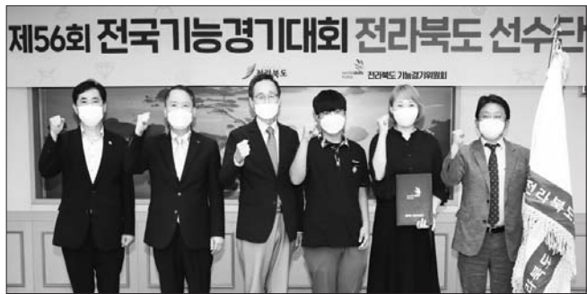
전북도는 27일 전북도청 회의실에서 송하진 도지사, 선수단 대표 2명, 도 기능경기위원회 관계자 등 방역수칙에 맞춰 최소인원만 참석한 가운데 전국기능경기대회 전북선수단 발대식을 가졌다.

규모 전국행사로 오는 10월 4일부터 11일까지 8일간 대전에서 열린다.