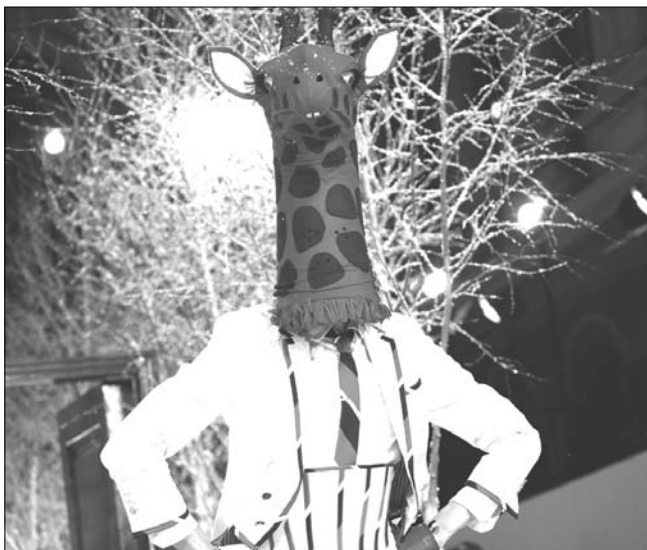
프랑스 여성 패션주간을 맞아 1일(현지시간) 파리에서 패션쇼가 열려 한 모델이 톰...