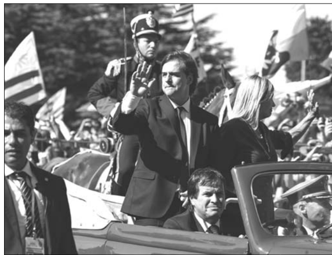
루이스 라카에 포우 우루과이 신임 대통령이 1일(현지시간) 수도 몬테비데오에서 무...