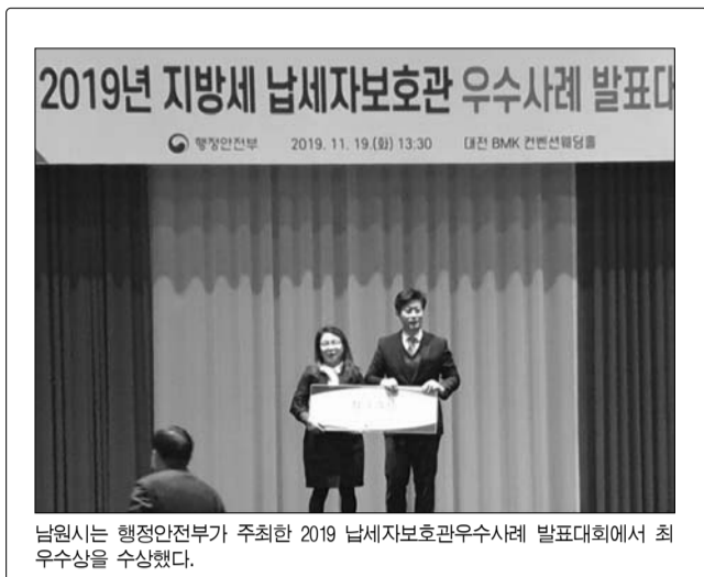
남원시는 행정안전부가 주최한 2019 납세자보호관우수사례 발표대회에서 최우수상을 수상했다.