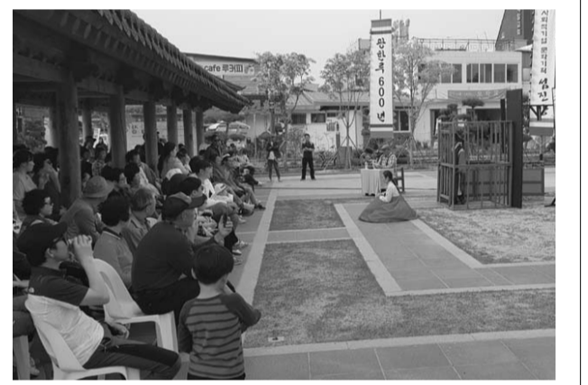
남원시 추석맞이 상설프로그램이 12일부터 남원예촌 문화마당 일원에서 열린다.

남원시가 추석을 맞이해 남원시와 예촌을 찾는 시민과 관광객들에게 즐겁고 신나는 행복한 시간을 보낼 수 있도록 다양한 체험행사와 공연, 이벤트를 마련 추진한다. 남원시가 준비한 추석맞이 상설 프로그램은 12일부터 15일까지 4일 동안 오후2시부터 6시까지 남원예촌 문화마당 일원에서 '즐거운 추석! 행복한 시간! 남원예촌 문화마당'이라는 주제로, 귀성객들과 시민들에게 즐겁고 행복한 추석이 될 수 있도록 마련했다. 행사내용은 다양한 전통놀이체험(웃놀이, 재기차기, 활쏘기 등 10여종) 행사가 게임과 즉석 이벤트로 추석연휴 4일간 오후2시부터 6시까지 진행되며, 14일과 15일에는 흥겨운 국악한마당이 오후 3시30분부터 4시10분까지 진행되고, 웃음과 해학이 넘치는 마당놀이 변사극 춘향전이 오후 4시30분부터 6시까지 곁놀이와 마당극으로 진행된다. 특히, 현장에서 직접 만들어 놀이