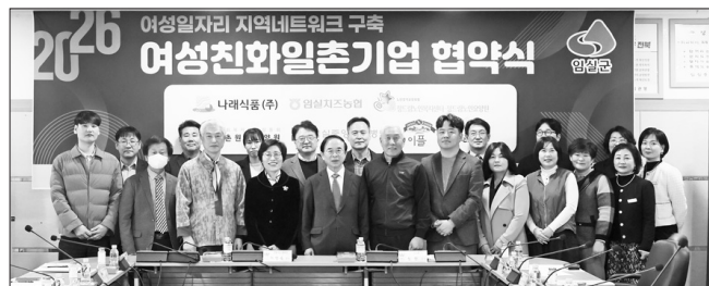
임실군은 19일, 군청 회의실에서 전북여성가족재단과 함께 관내 7개 기업과 여성친화일촌기업 협약식을 개최했다.