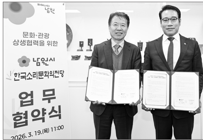
남원시는 19일 남원시청에서 한국소리문화의전당과 문화·관광 상생협력 양해각서(MOU)를 체결했다.

남원 방문을 유도하고, 체류형 관광 콘텐츠로 확장하는 새로운 협력 모델을 함께 모색하기로 했다.