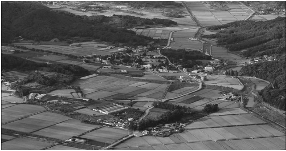
순창강천산 길목인 팔덕면의 기초생활과 경관 등 생활여건이 확 달라진다.