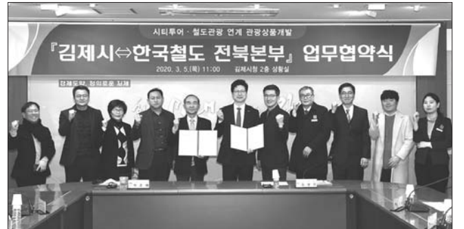
김제시와 한국철도 전북본부는 5일 김제시청에서 지역관광 활성화를 위한 관광상품개발 업무협약을 체결했다.

김제지평선축제 사진 전시전 등 홍보에 최선의 노력을 기울이고 있다. 한편 올해로 22번째 맞이하여 10월 7일부터 11일까지 5일간 개최되는 김제지평선축제는 글로벌행사, 문화행사, 전통행사, 체험행사, 야간부대행사 등 70여개 프로그램을 김제시 벽골제 및 김제 시내 등에서 환경(Eco), 자유(Free), 휴식(Rest)을 테마로 다양하게 운영할 계획이다. /김제=곽노태 기자