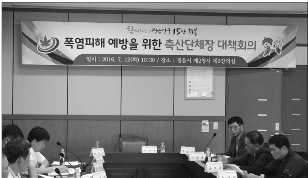
정읍시는 지난 12일 제2청사에서 축산단체장 등 축산인과 관계 공무원 등이 참석한 가운데 가축 폭염 피해 예방대책 회의를 가졌다. 시에 따르면 온도가 높은 시간대인 10시 ~ 17시에는 사료 급여를 자제하여야 한다.