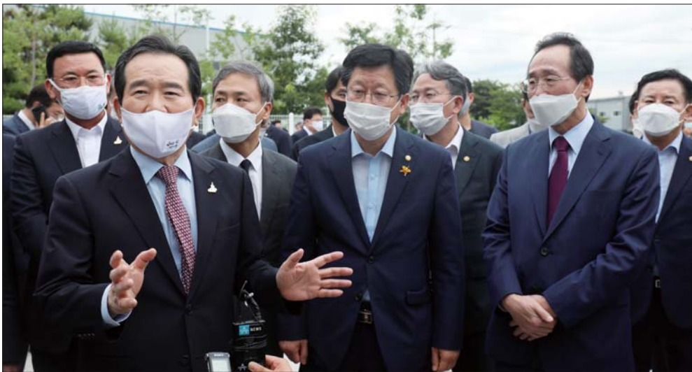
정세균 국무총리가 지난 3일 완주 수소총전소를 방문해 관계자에게 질문을 하고 있다.

정세균 총리 현지 방문 적극 지원 의지 피력 전주·완주·새만금 있는 수소 생태계 조성 속도